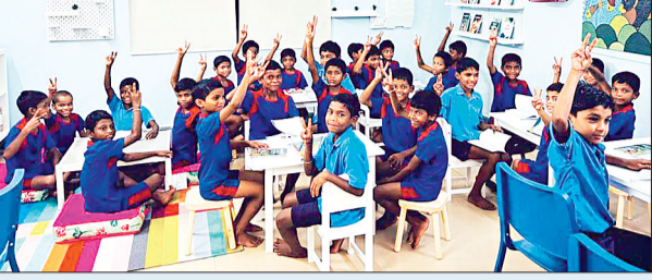
भंडारण, अनुपयोगी कंप्यूटर और स्मार्ट टीवी जैसी सुविधाएं शामिल थीं। इन समस्याओं को देखते हुए प्रशासन ने इनका समाधान करने का बीड़ा उठाया है। वरिष्ठ छात्रों को पुस्तकालयों का प्रबंधन सौंपा जाएगा, जिससे उनके नेतृत्व कोशल का विकास हो सके और जिम्मेदारी की भावना पैदा हो।

हाईटेक सुविधा विद्यार्थियों के लिए हाईटेक सुविधाएं आदिवासी छात्रावास अब केवल किताबों तक सीमित नहीं रहेंगे। उन्हें अब एसटीडीएम किट, डिजिटल शिक्षण सामग्री, और अवेजी सीखने के संसाधन भी प्रदान किए जा रहे हैं। इसके साथ ही, कंप्यूटर और स्मार्ट टीवी की कार्यक्षमता को सुनिश्चित करने के लिए तकनीकी ऑडिट भी किया जा रहा है। विद्यार्थियों की जिज्ञासा को बढ़ावा देने के लिए एक संरचित पाठ्यक्रम पेश किया जाएगा, जिससे उन्हें अपनी पढ़ाई में और निपुणता हासिल हो सके। प्रेरणा छात्रावासों में किए गए सर्वेक्षण में कई समस्याओं को देखते हुए प्रशासन ने इनका समाधान करने का बीड़ा उठाया है। वरिष्ठ छात्रों को पुस्तकालयों का प्रबंधन सौंपा जाएगा, जिससे उनके नेतृत्व कोशल का विकास हो सके और जिम्मेदारी की भावना पैदा हो।